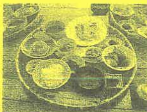
昼食にいただいた「ミニ籠御膳」です

南三陸町で、行政ではなく組合が運営している廃校を利用しての宿泊施設です。 小学校だった建物なので、木造校舎の軋む音が懐かしく、昔の小学校らしい手動のオルガンなどの設備が情緒あふれています。 地場産品を利用した季節感溢れる食事堪能出来るし、農業や漁業などの田舎生活を堪能でき都会からのピーターも多いそうです。 空気も美味しく癒しの空間でした。