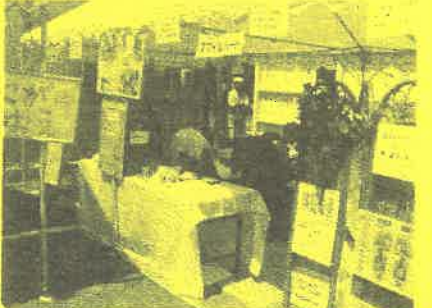
フットケアサークル スマイルハート