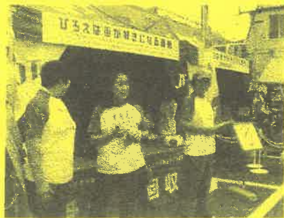
JT (ひろえは街が好きになる運動)