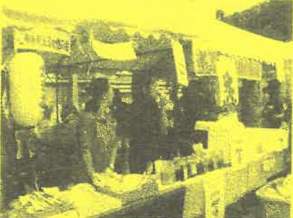
石巻を考える女性の会