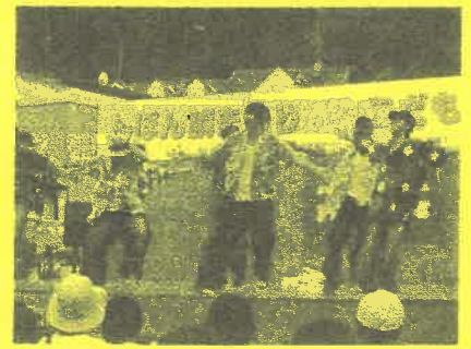
HIPHOP ストリートダンス「Favorite」