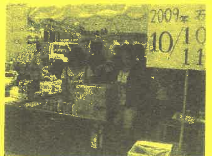
石巻専修大学 石鳳祭実行委員会