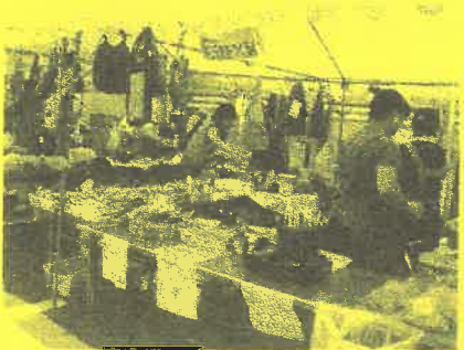
手作りで元気を作る会