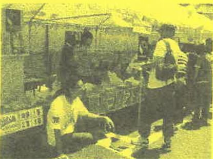
NPO法人 フェアトレード東北