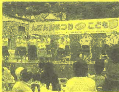
フラダンス (カハラ オハワイ)