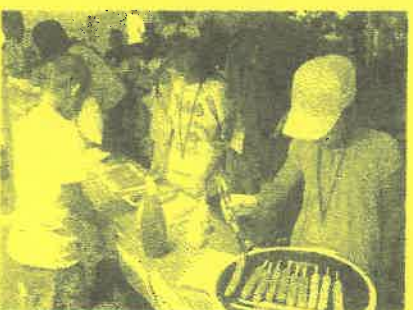
いしのまきNPOセンター ふるさと体験事業 「しごと探検隊2009」