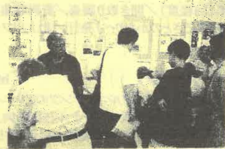
↑ NPOスマート・シニアいしのまきによるパソコン体験

主催 特定非営利活動法人 いしのまきNPOセンター 共催 石巻市 当日の8月24日は朝からあいにくの空模様...しかし、10時の開会式後からは徐々に天気は回復し多くの人でにぎわいました。第1回という初めてのまつりでしたが、来場者数は250にのぼり次回への期待も高まっています