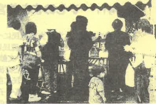
↓ 地域・国際貢献サークル フォーラ夢による民族衣装体験コーナーに用意された衣装の一部