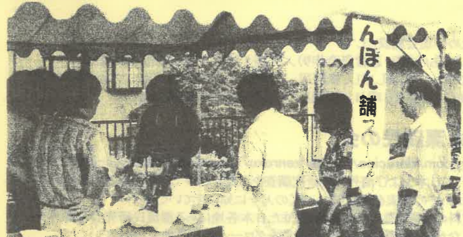
↑ 大好評だった100食限定無料の「んぽん舗スープ」 ↓ モンゴルの民族衣装でスープをPR!! ちなみにスープはイタリア風