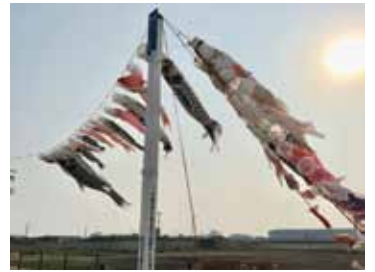
現在のこいのぼり